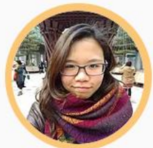
家芸 國立臺灣大學大使 人才學習發展中心 實習生