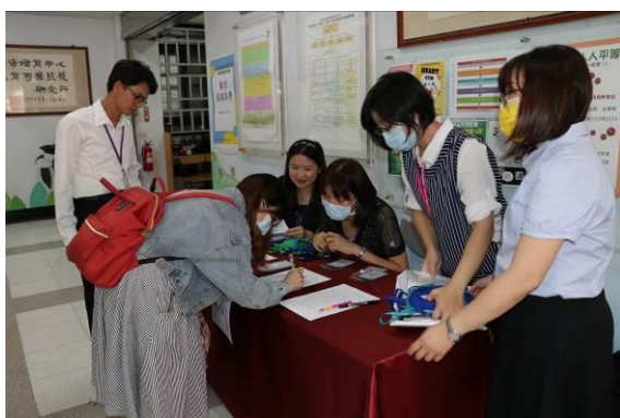
教育學術研討會-報到