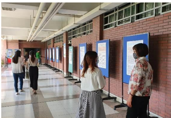
海報發表組 (海報 11 篇)