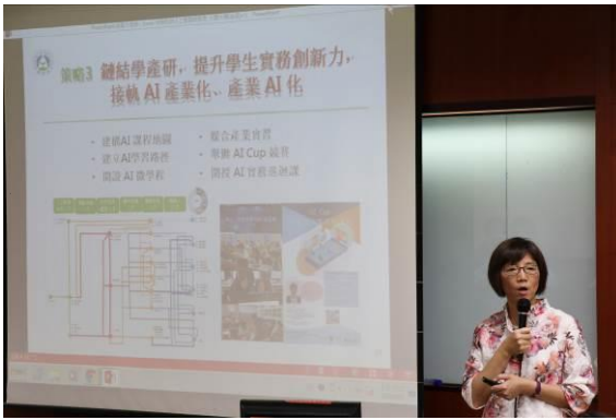
專題演講 • 劉文惠教育部資訊司副司長