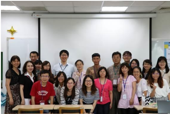
口頭發表 • C場會後合影