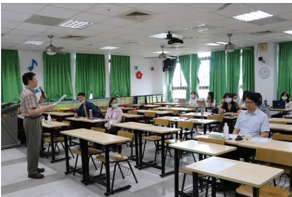
口頭發表 • C場 J402