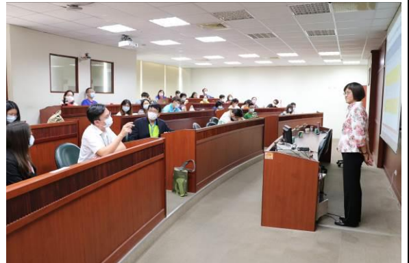
專題演講 • Q&A 互動時間