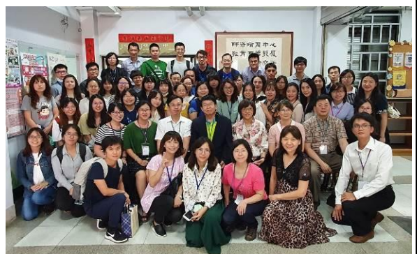
專題演講 • 大合影