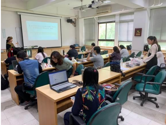
口頭發表 • B場 J406