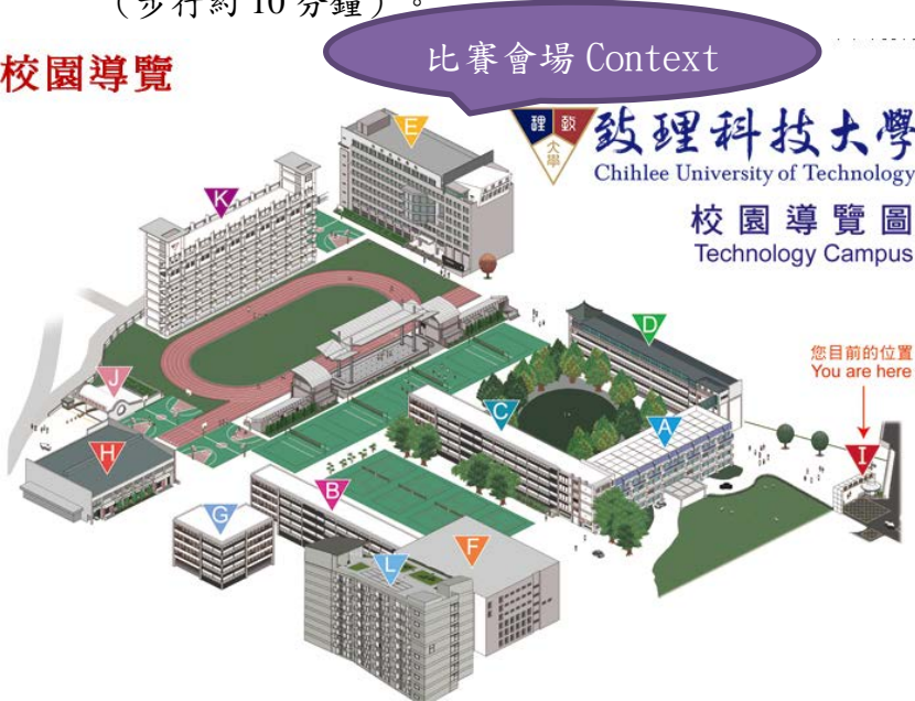
圖 1 校園導覽圖